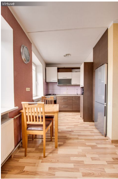
Svetainė su virtuve 35,46 kv. m.