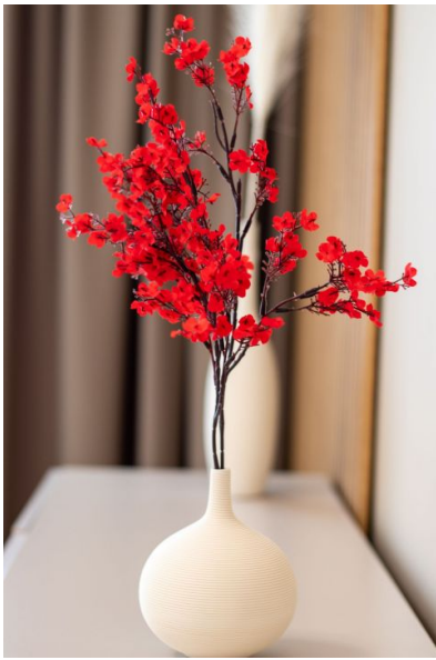
Svetainė ir prieškambaris 19,17 kv. m.