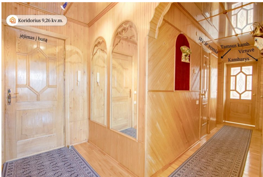
Koridorius 9,26 kv.m.