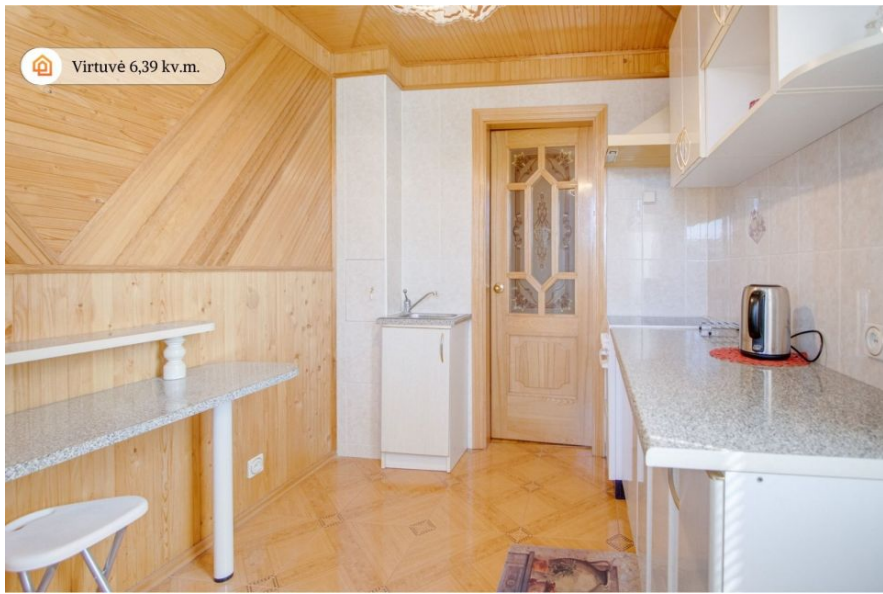
Virtuvė 6,39 kv.m.