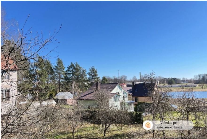
🏠 Vaizdas pro miegamojo lango