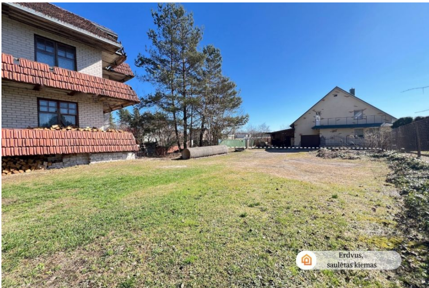
🏠 Erdvus, saul3tas kiemas