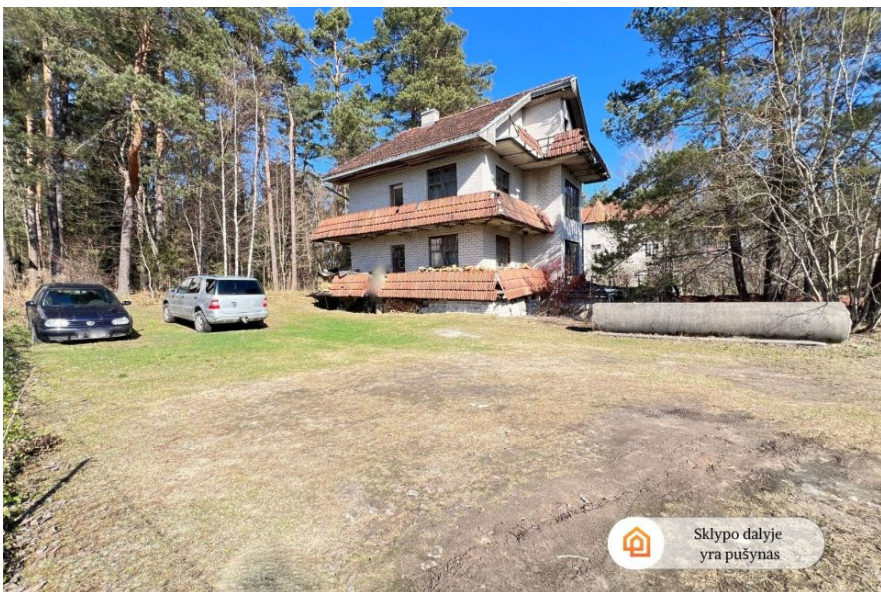
Sklypo dalyje yra pušynas