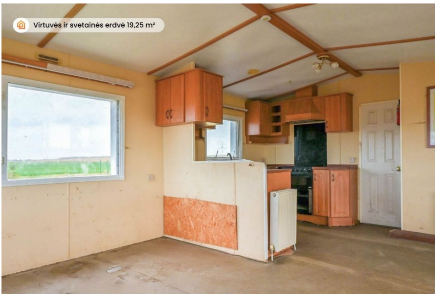
Virtuvės ir svetainės erdvė 19,25 m 2