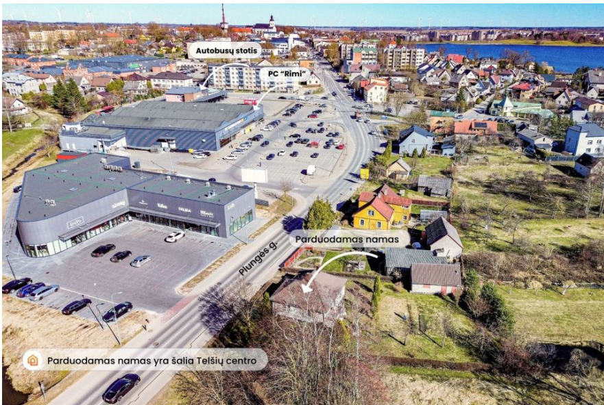
Parduodams nams yra šalia Telsių centro