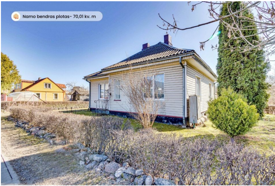
Namo bendras plotas- 70,01 kv. m