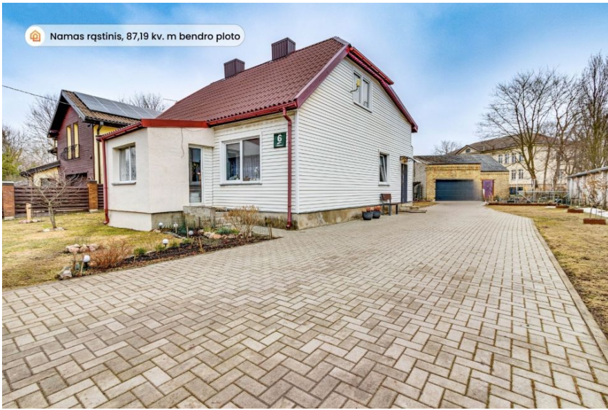
Namas rąstinis, 87,19 kv. m bendro ploto