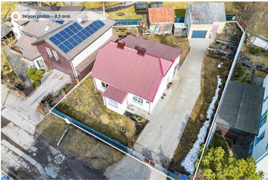
Sklypo plotas - 8,3 arai