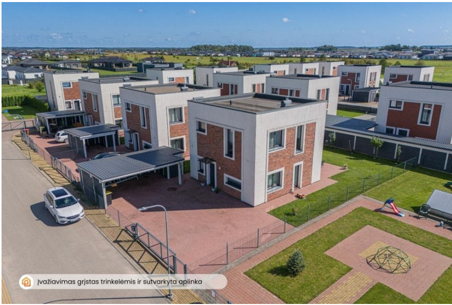
🏠 Įvažiavimas grįstas trinkelėmis ir sutvarkyta aplinka