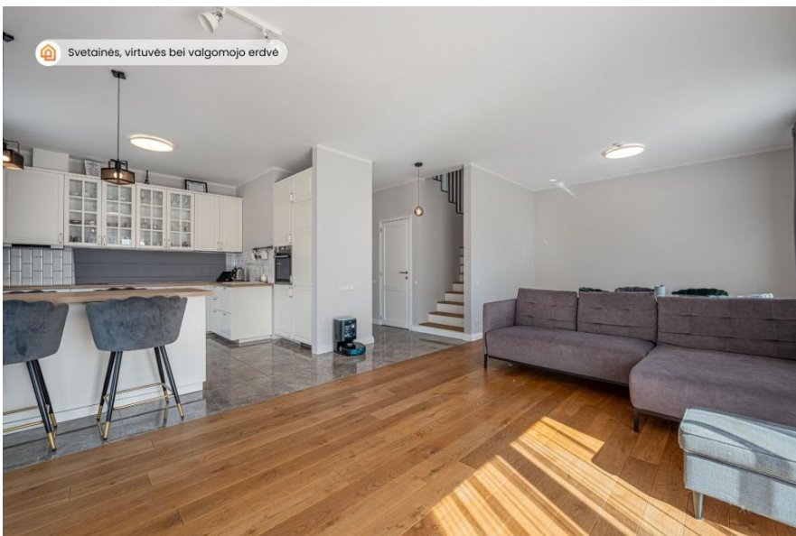
🏠 Svetainės, virtuvės bei valgomojo erdvė