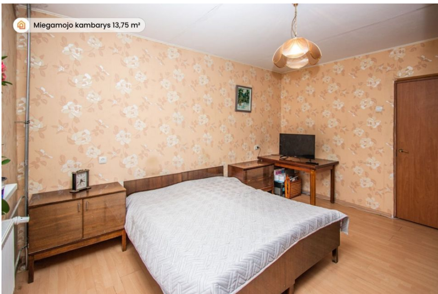
Miegamojo kambarys 13,75 m²