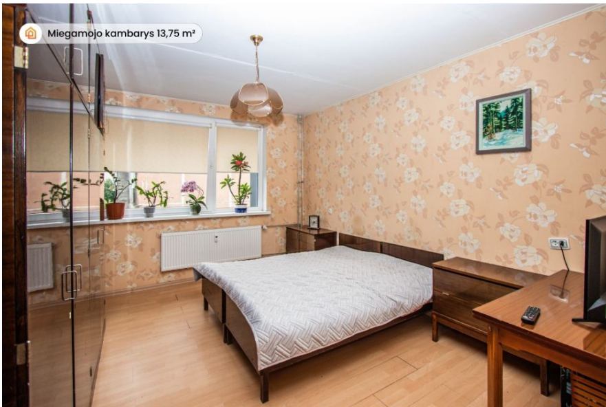
Miegamojo kambarys 13,75 m²